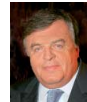
Prof. Dr. Helmut Thoma langjähriger Geschäftsführer von RTL